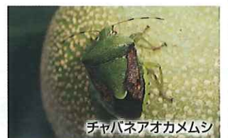
チャバネアオカメムシ