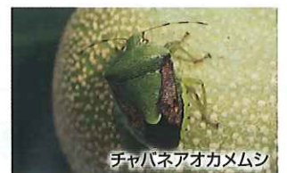
チャバネアオカメムシ