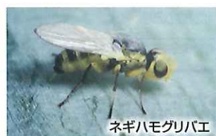
ネギハモグリバエ