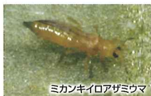
ミカンキイロアザミウマ