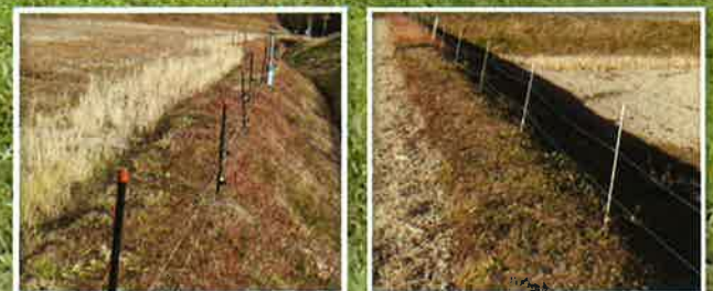
水田畦畔の電気柵設置状況

草刈り機による断線防止に除草剤を有効に利用した 電気柵の維持管理をおすすめします