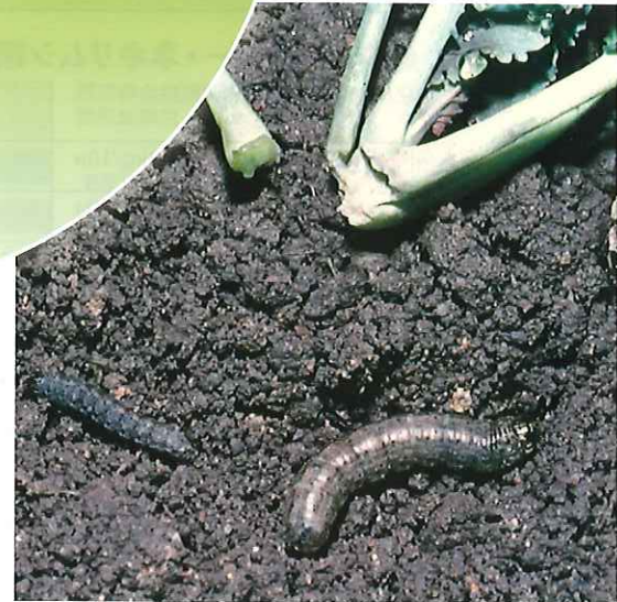
ネキリムシ(カブラヤガ)